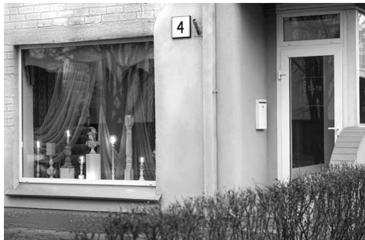
Valančiaus gatvėje veikiančio užuolaidų salono vitrina traukia praeivių akį.