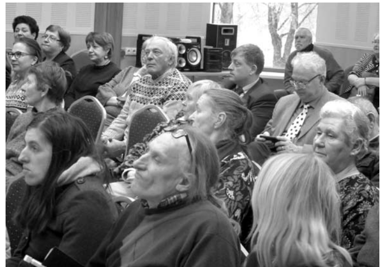
Į susitikimą su ministru atvykę anykštėnai turėjo dešimtis klausimų.

„Jeigu įvestume 120 eurų išmoką visiems vaikams - tai nelygybė Lietuvoje tik išaugtų, nes