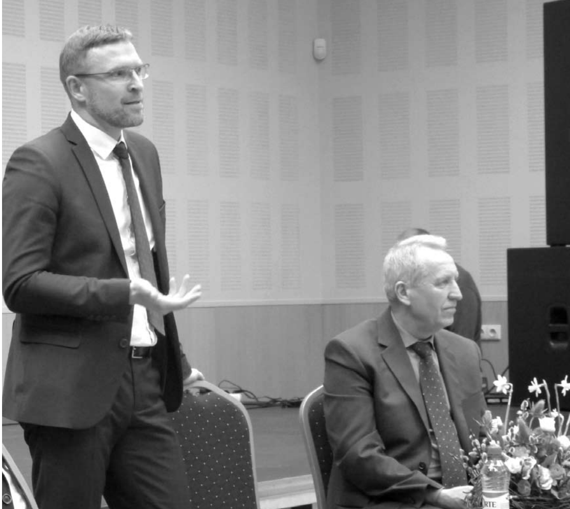
Socialinės apsaugos ministras Linas Kukuraitis sakė esąs įsitikinęs, kad eina teisinga kryptimi.

Į kultūros centrą susitikti su ministru bei jį lydėjusiais Seimo nariais - „valstiečiais“ Tomu Tomilinu ir Antanu Baura - atėjo keliasdešimt anykštėnų.